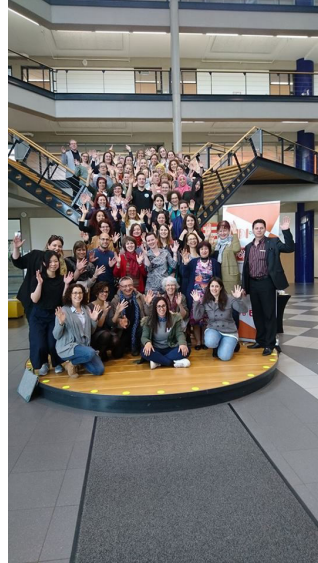
תמונה 5. משתתפי פרויקט LUDI

בתהליך הייתה חשובה מאוד, חשוב היה לשמוע על הצרכים שלהם ועל החוויה שלהם כהורים וכמובן של הילדים. המפגש היה משמעותי ומלמד, והחוויה עצמה הייתה חזקה ומרגשת.