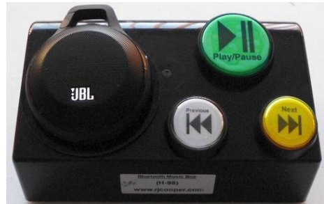
תמונה 4. נגן מוזיקה

החברה של המפתח RJ Cooper - אדם שבמקצועו מכין ומספק מכשירים ואביזרים לאנשים עם מוגבלויות מורכבות. באתר המקוון https://store.rjcooper.com אפשר להתרשם מן המגוון הרב של המוצרים. בייחוד התרשמנו מנגן המוזיקה, המתחבר ל-MP3 וניתן לתפעול על ידי כפתורים גדולים. אפשר להזמין עם חיבורים למתגים וגם בגרסת בלוטוס כדי לחבר לכל מכשיר.