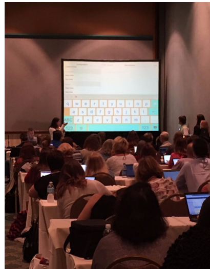
תמונה 2. הצגת האפליקציה ל-300 אנשים

האפליקציה מאפשרת לעצב את המקלדת הווירטואלית (המקלדת של האייפד) לפי הצבעים הרצויים, אפשר לחלק את המקלדת לפי שורות או אזורים, להחליט שרק אותיות מסוימות יהיו בצבע אחר (אותיות סופיות למשל) ואף להחליט שרק אותיות מסוימות יופיעו (כפי שמופיע בתמונות מטה). על האפליקציה אפשר לקרוא בהרחבה בבלוג הבית שלנו ב"טכנולוגיה באיזי".